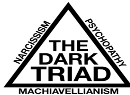
الثالوث المظلم the dark triad